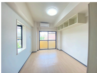
洋室 キッチン ユニットバス 温水洗浄暖房便座