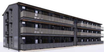
※完成予想図の為実際とは異なる場合があります