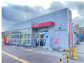
セブンイレブン 西条下見店 (1,147m)