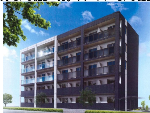
1 オートロックシステム